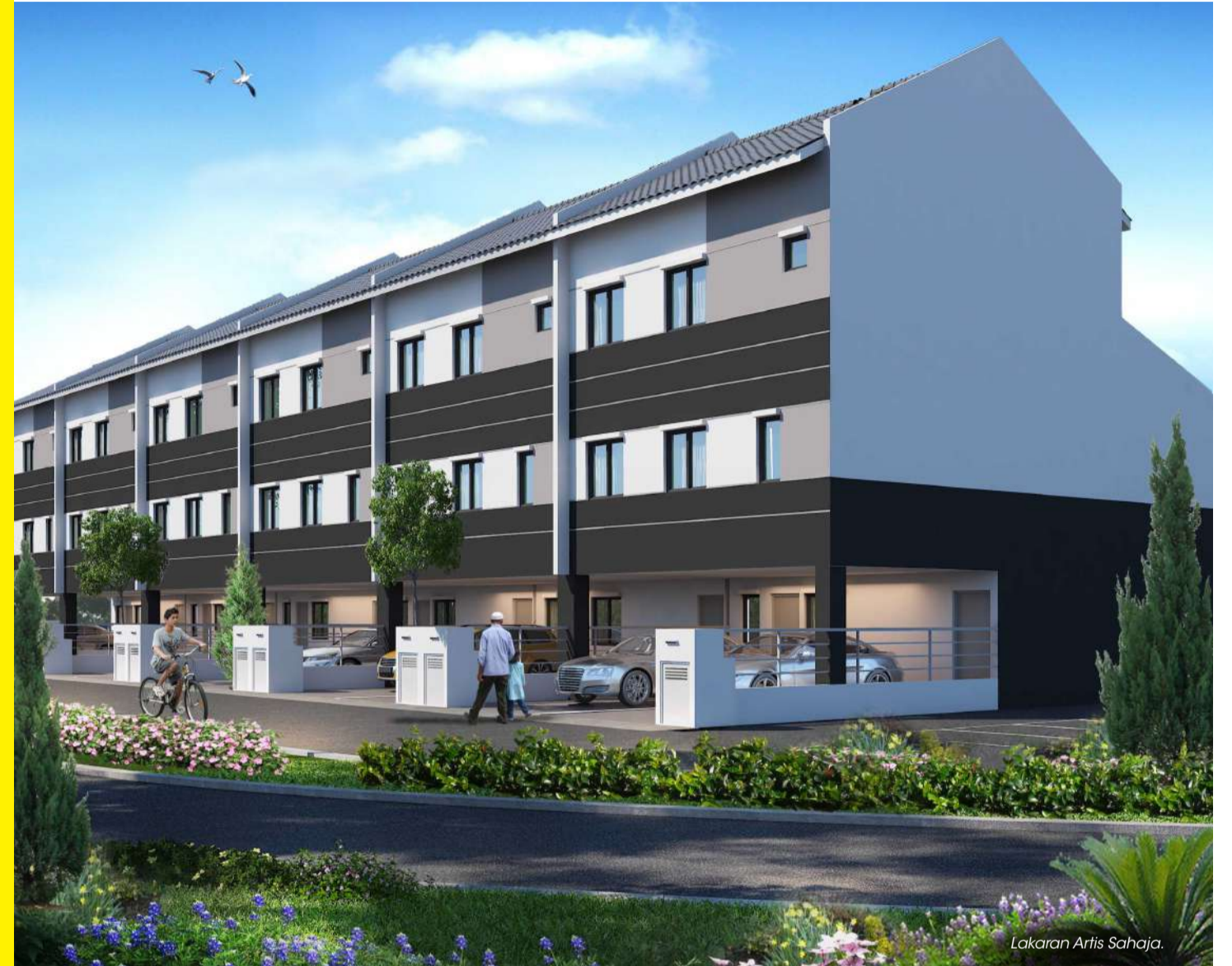
Lakaran Artis Sahaja.